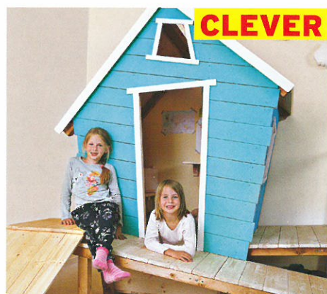
CLEVER Kinderspielhaus selber bauen Schritt für Schritt S. 110