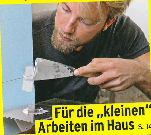
Für die „kleinen“ Arbeiten im Haus S. 14

Wichtig zu wissen S. 45 So schärfen Sie Ihre Werkzeuge richtig