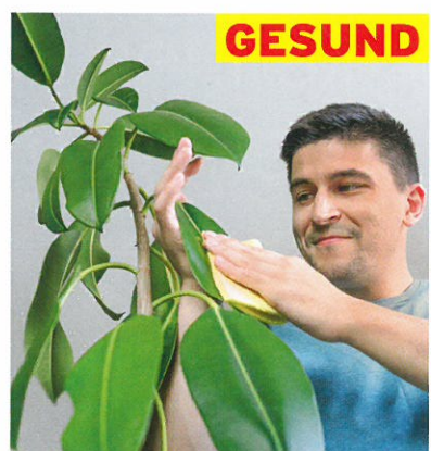
GESUND Zimmerpflanzen im Winter Gutes Raumklima S. 86