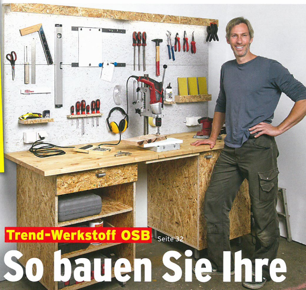
Trend-Werkstoff OSB Seite 32

Nordmantannen S. 96 Woher kommen die Weihnachtsbäume?