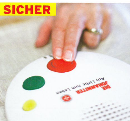
SICHER Schnelle Hilfe im Notfall S. 22 Effektive Alarmsysteme