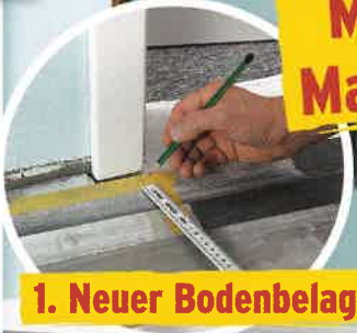
1. Neuer Bodenbelag

So sorgen Sie für ein gesundes Wohnklima S. 49