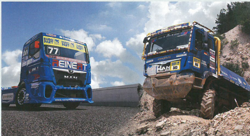
Europart: weil Leidenschaft verbindet