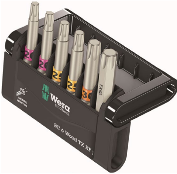
Le Bit-Check 6 Wood TX HF 6 pièces