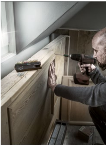
Ça envoie du bois !